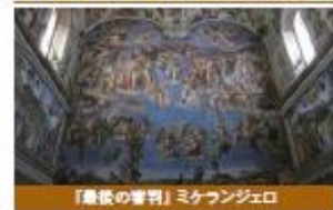
『最後の審判』ミケランジェロ

世界的に人気で 予約の確保が難しい レオナルド・ダ・ヴィンチの傑作『最後の晩餐』鑑賞(注2)