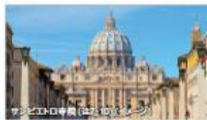
世界遺産 バチカン市国