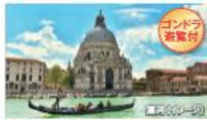
世界遺産 水の都 ベネチア