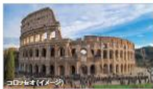
世界遺産 永遠の都 ローマ