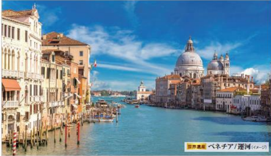
世界遺産 ベネチア/運河(イメージ)