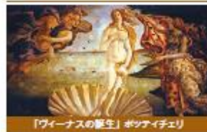
『ヴィーナスの誕生』ボッティチェリ