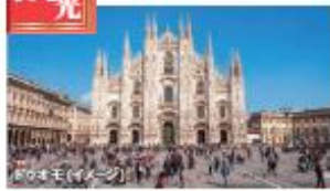
流行と文化の都 ミラノ