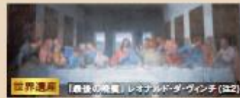
世界遺産 『最後の晩餐』レオナルド・ダ・ヴィンチ(注2)

世界的に人気で 予約の確保が難しい レオナルド・ダ・ヴィンチの傑作『最後の晩餐』鑑賞(注2)