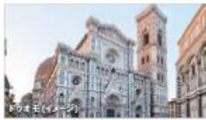
世界遺産 花の都 フィレンツェ