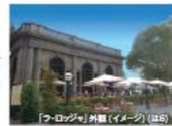
『ラ・ロッジャ』外観(イメージ)(注6)